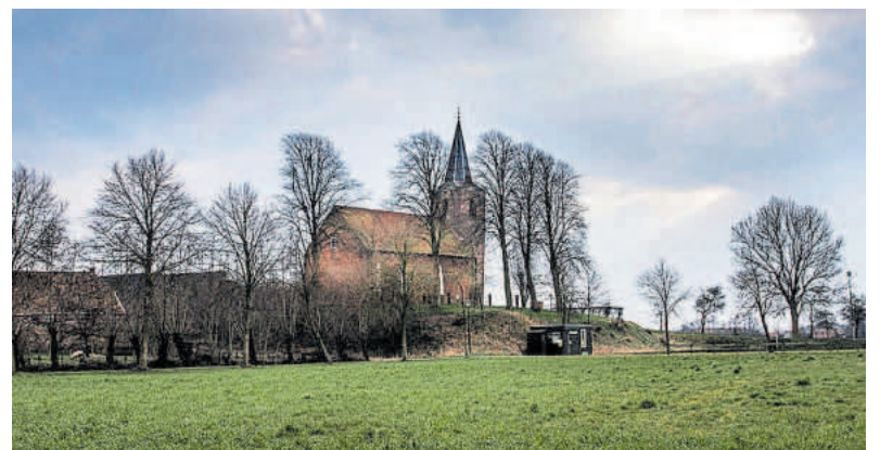
Romaanse kerk uit 12e eeuw op een wierde in Eenum.

Het kan niet anders dat de grootchalige woningbouw en bijbehorende infrastructuur ten koste gaan van waardevolle landschappen en een grote druk leggen op onze be-