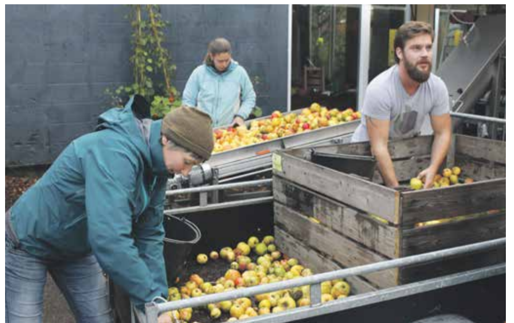
Het team van Doggerland Craft Cider

Op de overdekte appelmarkt was het tevens goed toeven. Bezoekers konden onder meer appelthee, appeljam en ap-