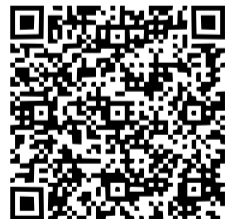
Scan de QR code voor het filmpje