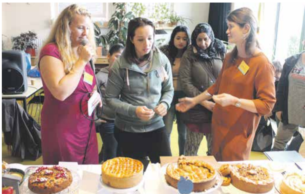
Heel Groningen Bakt... Appelkaart

Op zondag 22 oktober organiseerden de Natuur en Milieufederatie Groningen en Toentje op het terrein van Toentje in de Oosterparkwijk het Appelfeest. Ter voorkoming van verspilling en ter ere van deze veelzijdige vrucht! Van 10 tot 17 uur konden bezoekers hun appel- (of peren) oogst inleveren om te laten persen tot houdbaar sap of afgeven om te laten verwerken tot cider. Ook was er een appeltaartenbakwedstrijd, een appelmarkt en diverse kinderactiviteiten. Met ruim 500 bezoekers, 1000 liter appelsap en een goed bezochte taartenbakwedstrijd kijken de organiserende partijen terug op een geslaagd evenement.