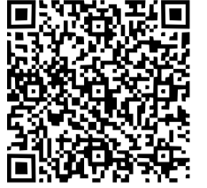
Scan de QR code voor het filmpje

Over deze vraag ging het debat georganiseerd door de Natuur en Milieufederatie op woensdagavond 22 november. Met het Gasuniegebouw als decor gaven gerenommeerde wetenschappers en ervaringsdeskundigen hun visie op de rol van biomassa in de energietransitie. Samen met zo'n 125 deelnemers in de zaal leverde dit een breed inhoudelijk programma en een levendige discussie op.